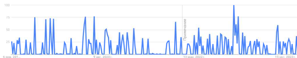
Рис. 1. Инфографика поискового запроса словосочетания на русском языке «экономические границы» Google Trends за последние 5 лет

Проведенный авторами настоящей статьи анализ поисковых запросов на международной поисковой платформе в Google Trends показал, что на русском языке словосочетание «экономические границы» за последние пять лет в мировом поиске было активным. Самые активные точки: 2–8 июня 2019 г. – 75 запросов, апрель – август 2020 г. – 76 запросов, 20–26 ноября 2022 г. – 100 запросов, 27 августа – 2 сентября 2023 г. – 59 запросов. Результат инфографики представлен на рис. 1 [4].